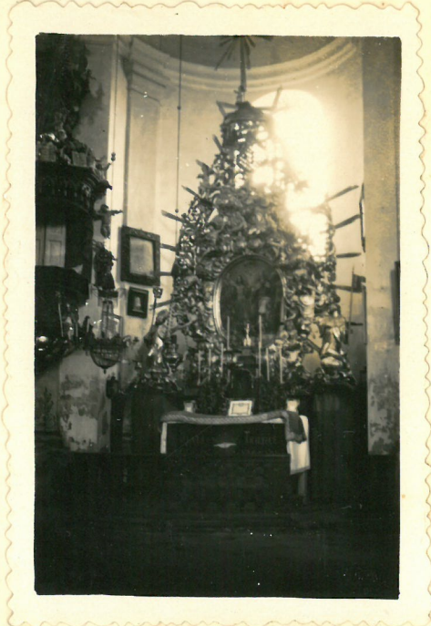
Hlavní oltář kostela Njso. Trojice.