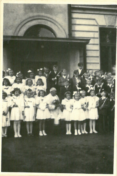
1. sv. přijímání 1952 3. řada sedí.