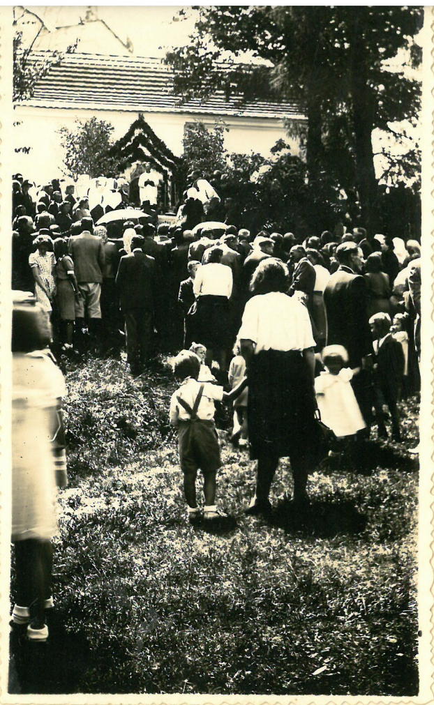
Klářanů vop. Lúbrla.