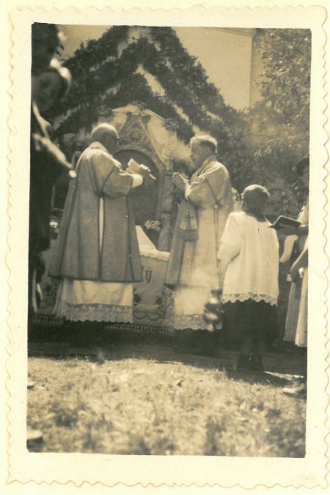
Evangelium při slavné mši sv.