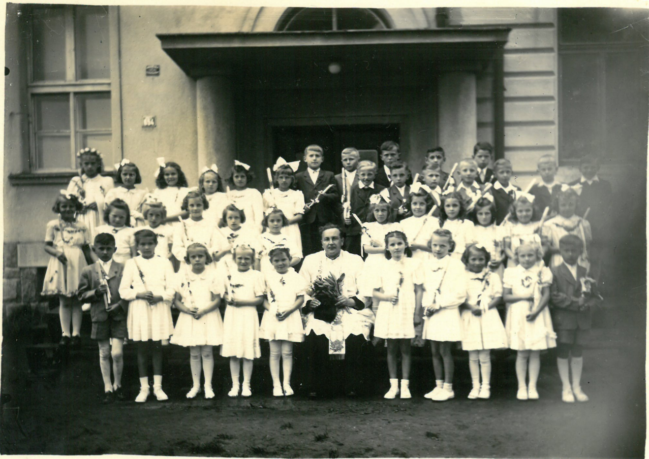
1. sv. přijímání 1952 - druhé třídy radejčel.