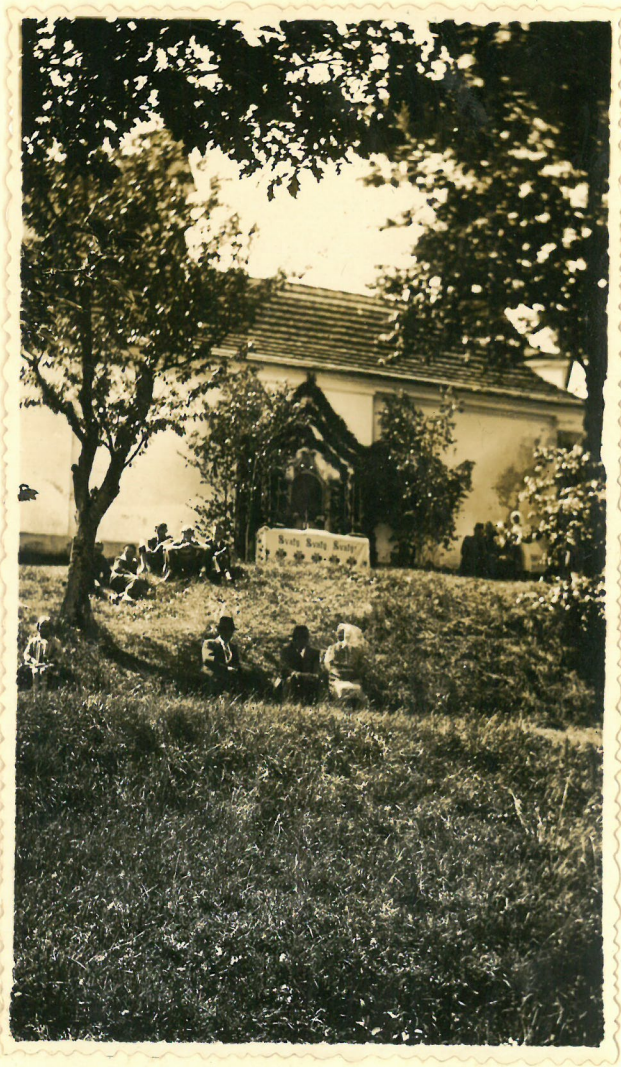
Uklon před ambity