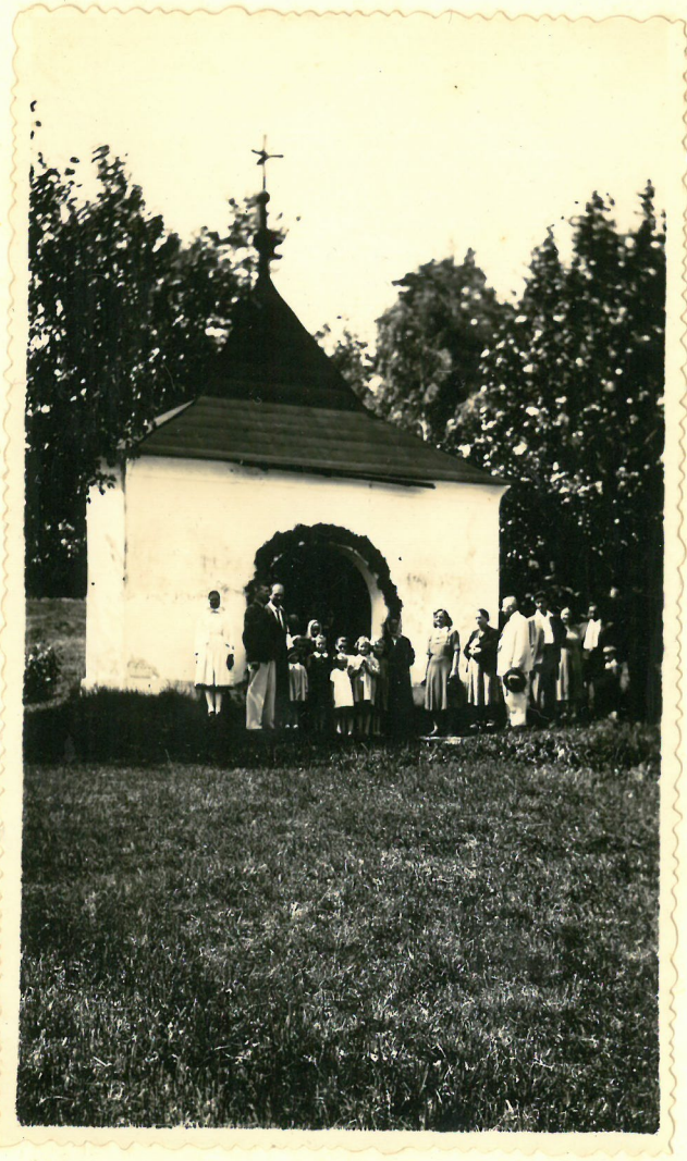
Uklon před ambity