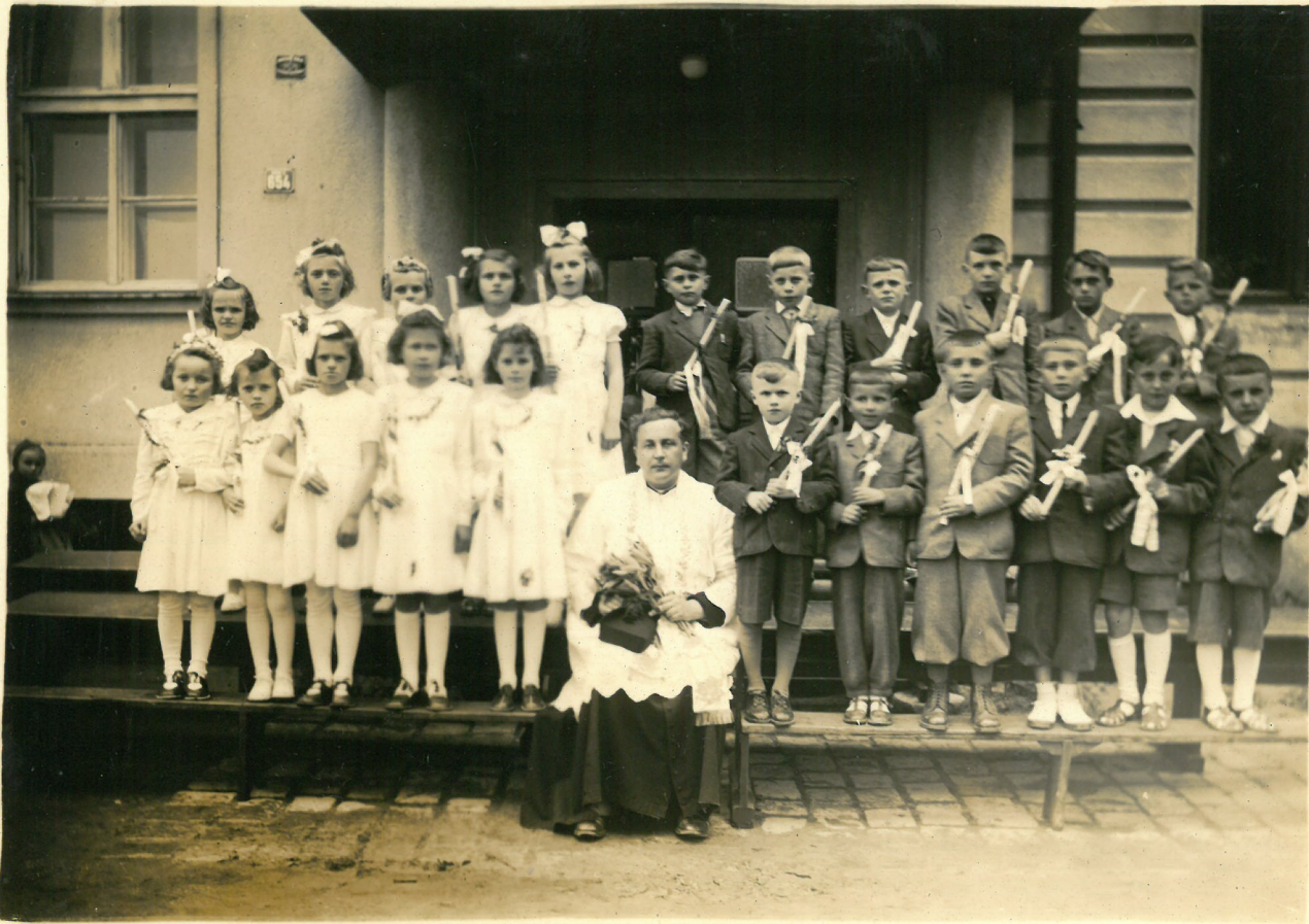
1. sv. přijímání 1952 - přespolní školy.