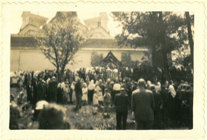
Ze vše sv.